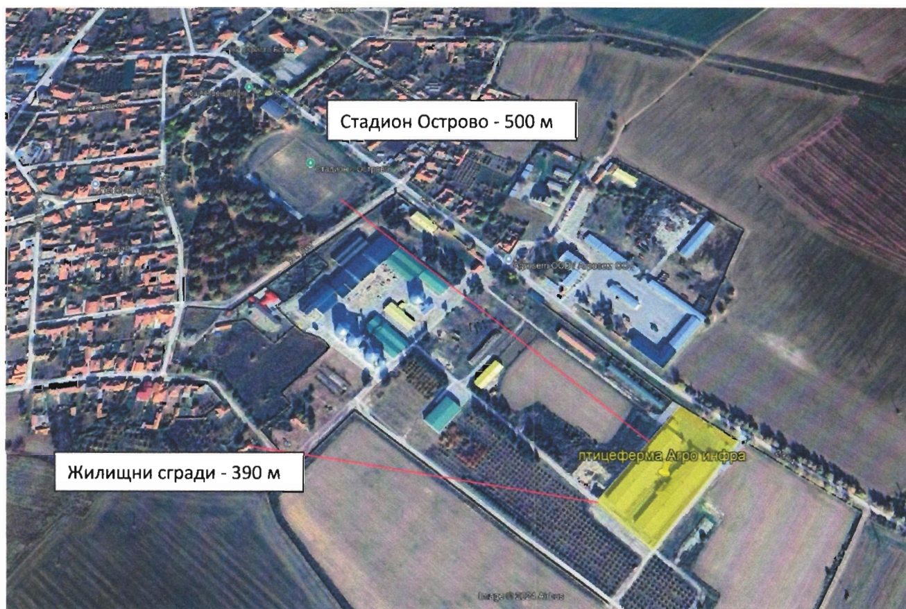
фиг. 2 Отстояние на площадката до най-близките обекти, подлежащи на здравна защита