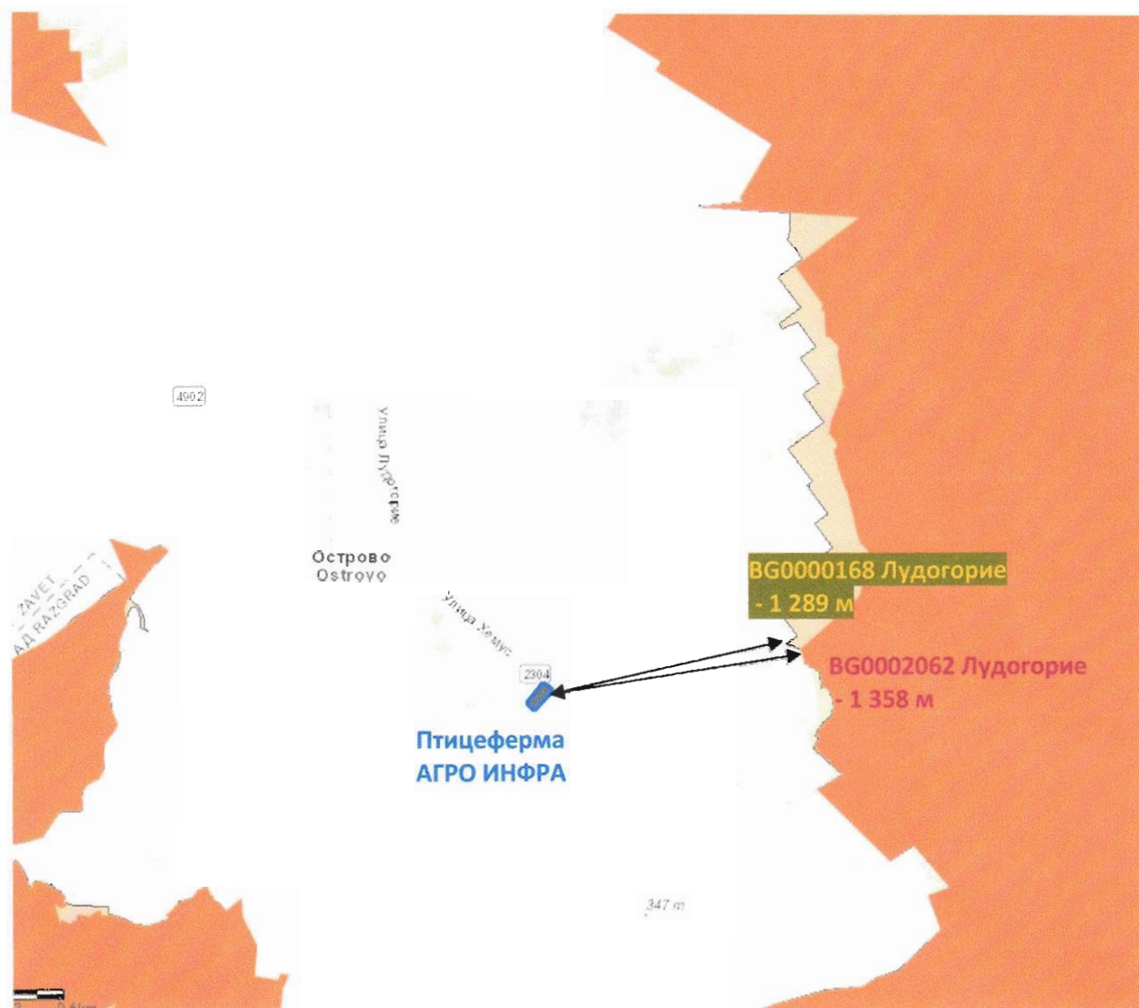
фиг. 3 Отстояние на площадката до най-близките Защитени зони

Въложител: „АГРО ИНФРА“ ЕООД – с. Острово, общ. Завет „Промени в параметрите на инсталация за интензивно отглеждане на птици – УПИ XX и XXI от кв. 42, по ПУП с. Острово, община Завет, област Разград“.