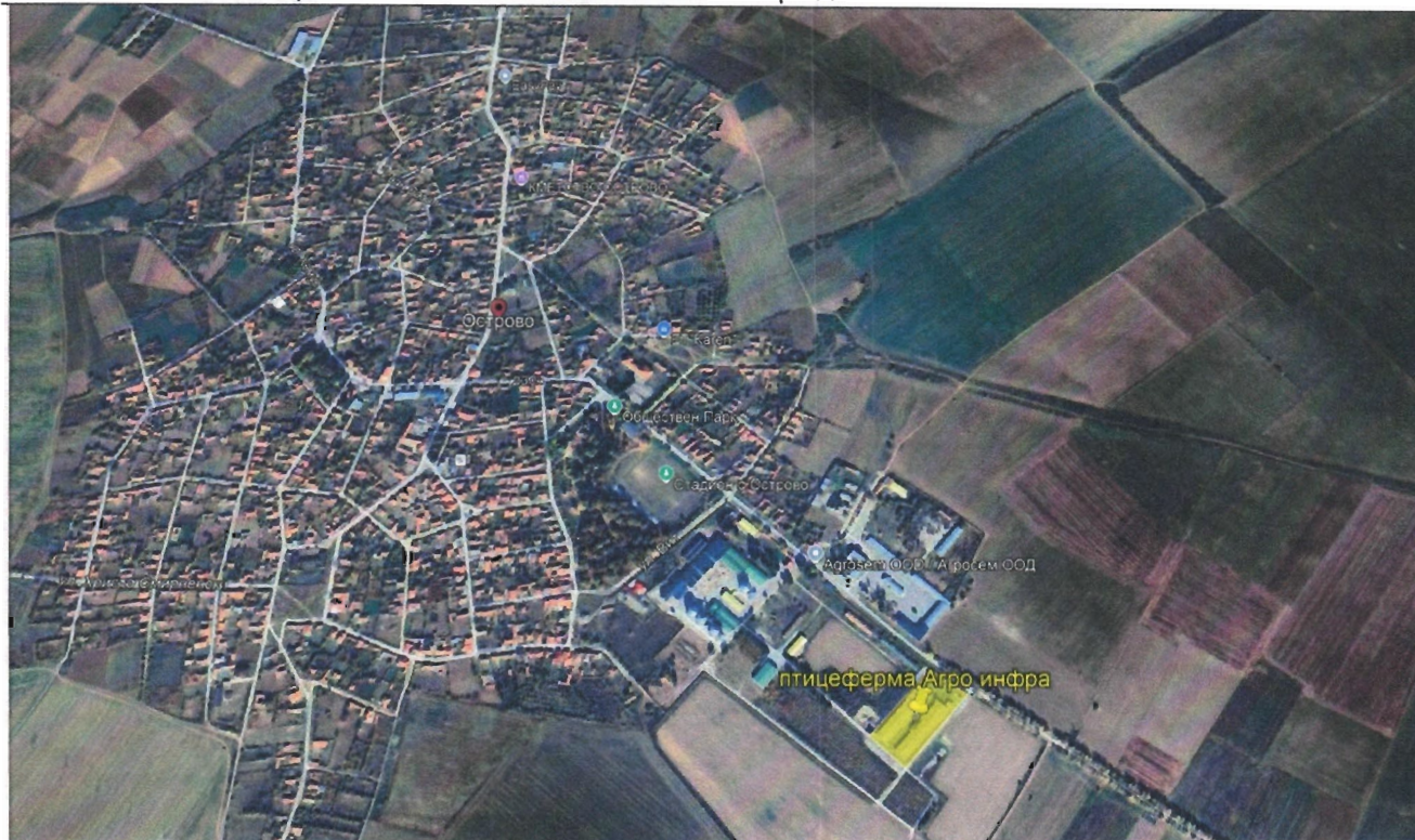
фиг. 1 Сателитна снимка на площадката

Възложител: „АГРО ИНФРА“ ЕООД – с. Острово, общ. Завет „Промени в параметрите на инсталация за интензивно отглеждане на птици – УПИ XX и XXI от кв. 42, по ПУП с. Острово, община Завет, област Разград“.